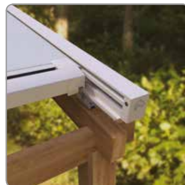
Sécurité mécanique pour la barre de charge