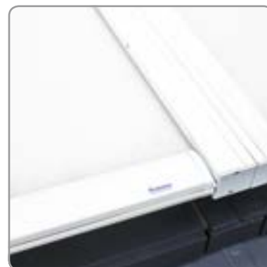
Détail barre de charge