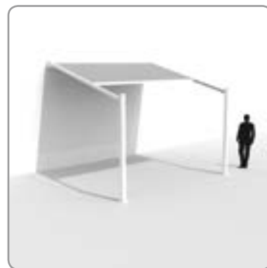
Option 1 avec évacuation d'eau

N.V. RENSON® Sunprotection-Screens S.A Kalkhoevestraat 45 • IZ 1 Flanders Field • B-8790 Waregem Tel. +32 (0)56 62 65 00 • Fax +32 (0)56 62 65 09 info@rensonscreens.be • www.renson.eu